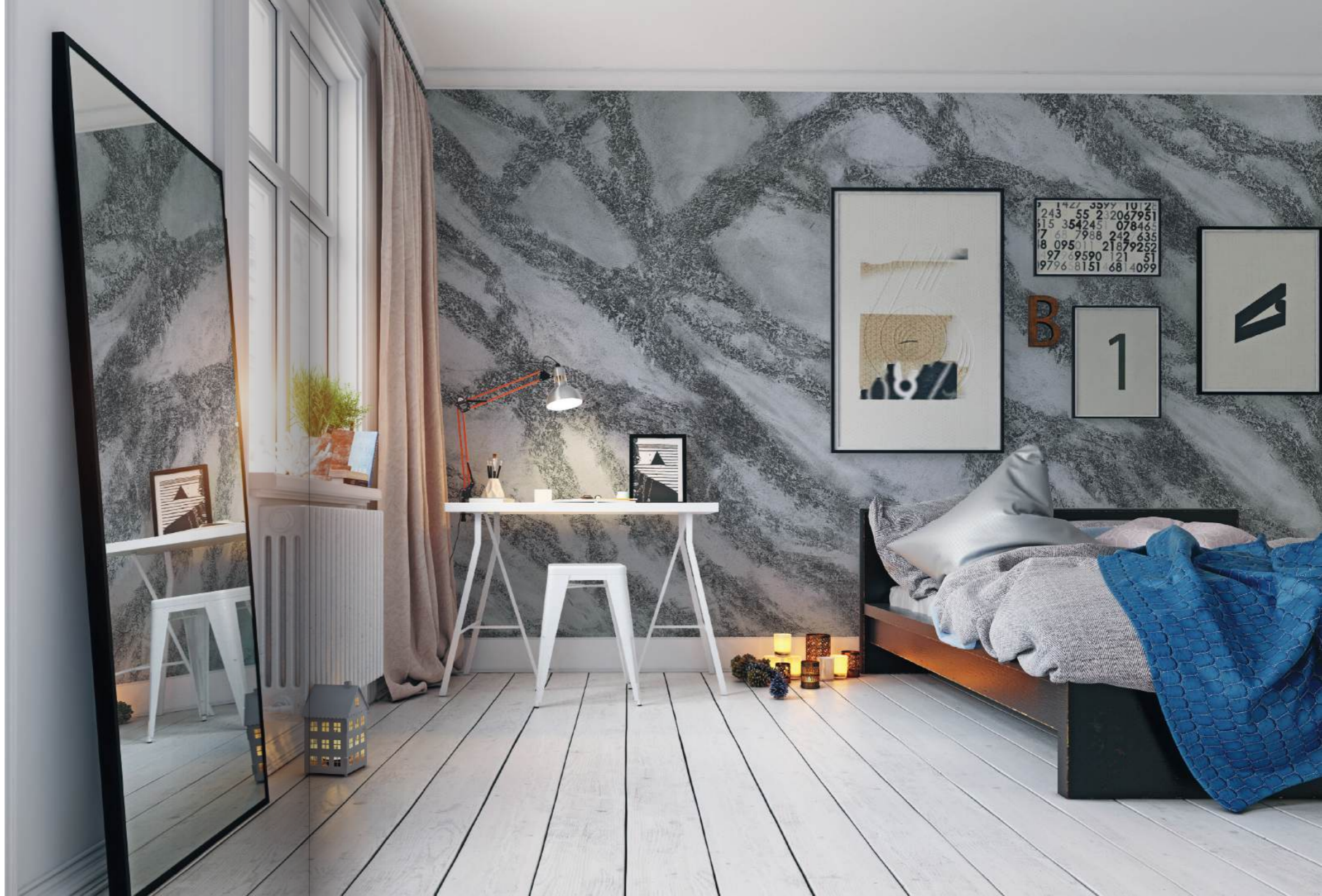
EFFETTO TRAVERTINO DESIGN TRAVERTINO NERO TR 2.564 + MILLENNIUM ARGENTO