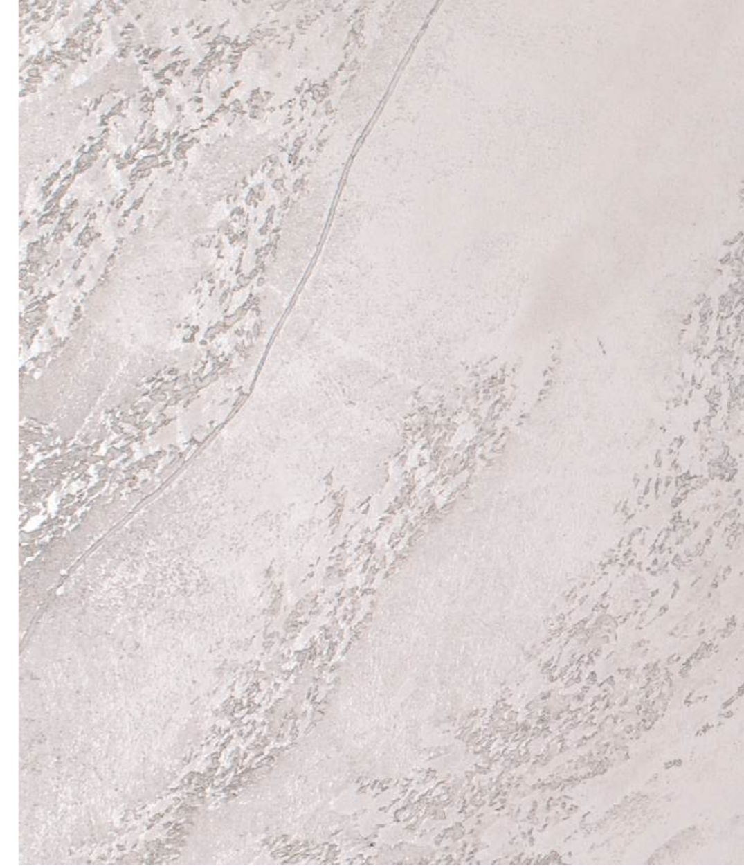
EFFETTO TRAVERTINO NATURALE TRAVERTINO NEUTRO + NARCISO NA 2 516