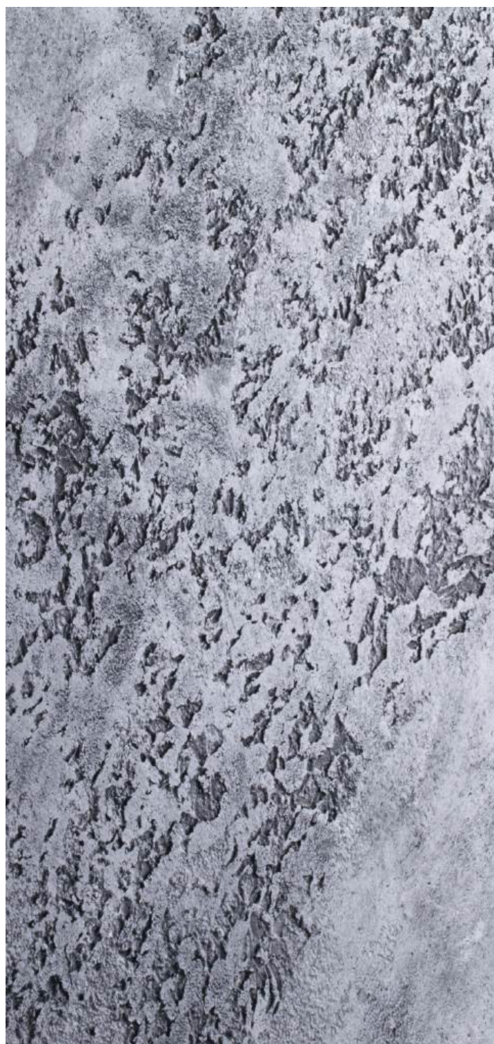
EFFETTO TRAVERTINO NATURALE TRAVERTINO NERO TR 2 564 + MILLENNIUM ARGENTO