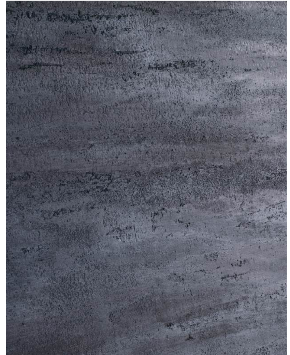
EFFETTO PIETRA LAVICAE TRAVERTINO NERO TR 2 564 + IL DUCALE V1 574 + IL DUCALE V1 562