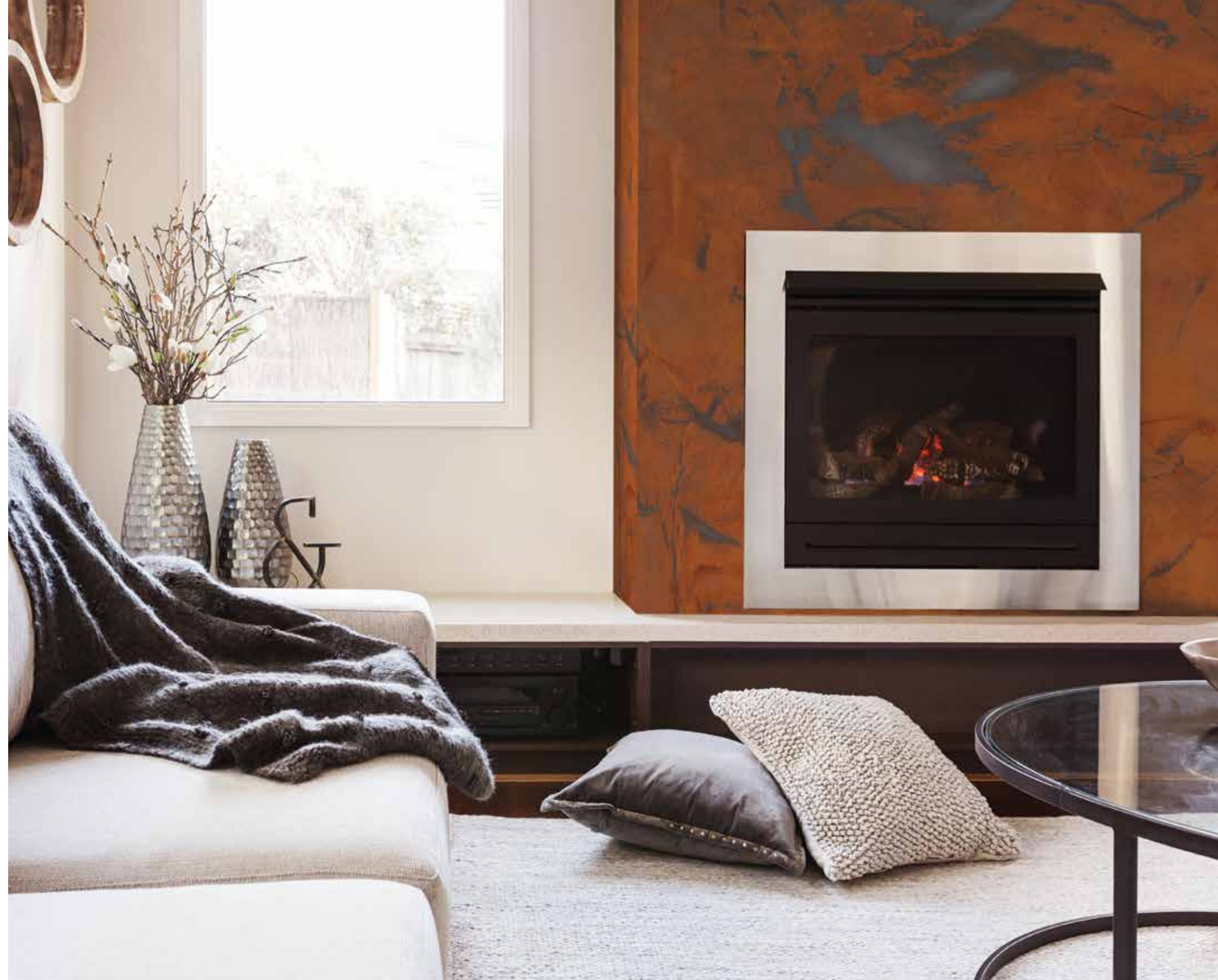
EFFETTO RUGGINE OLD RUST FERRO