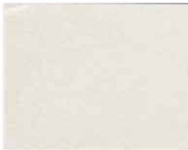
NUVOLA BASE ARGENTO

METALLIC ACRYLIC DECORATIVE FINISH WITH SILKY EFFECT