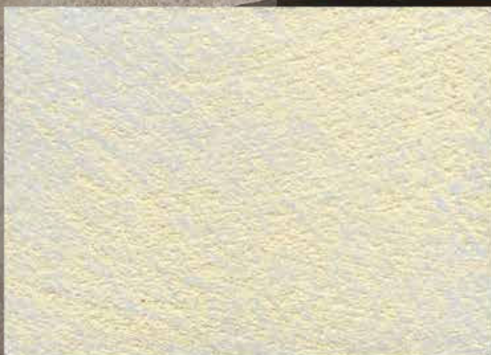
BASE ORO / SABBATO NORMALE