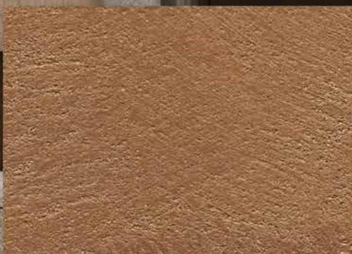
BASE BRONZO / SABBATO NORMALE