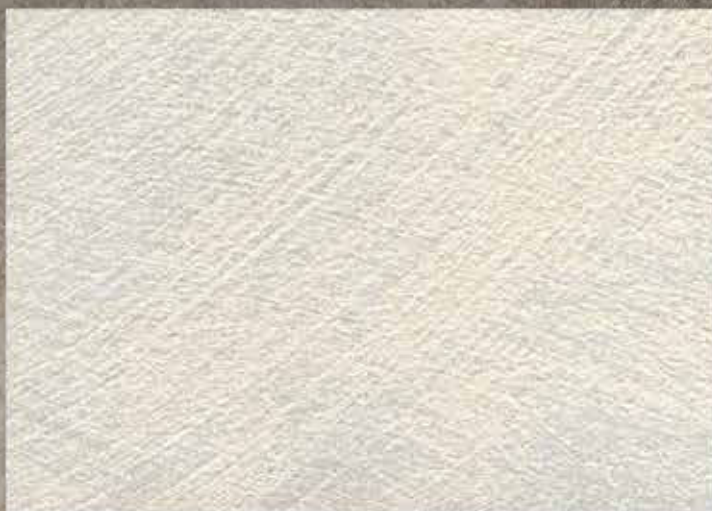
BASE ARGENTO / SABBATO XS

The colours in this catalogue can all be reproduced using the Giolli Colour System.